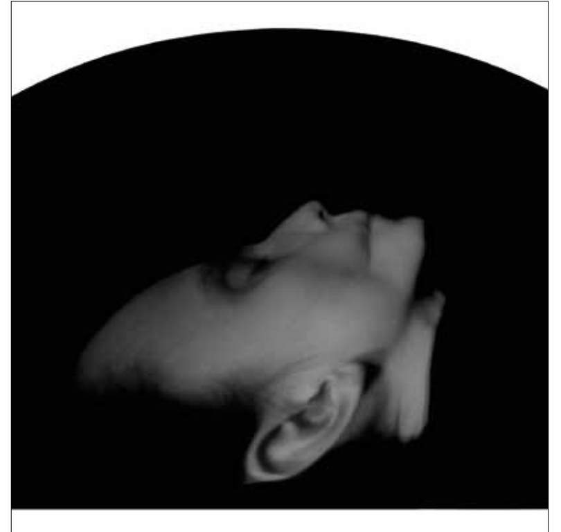
„Boska beztroska I“ (aus dem Projekt EXodus ), 2008 Lochkamerafotografie auf Silbergelatinepapier, getont, 21,0/25,2 x 30,2 cm, Edition 5 + 2 AP

* in Polen, Fotokünstlerin, arbeitet v.a. mit Lochkamera und nutzt analoge Bildmanipulationen; in ihren Fotoarbeiten und Installationen beschäftigt sie sich mit den Themen Identität, Entschleunigung und Vergänglichkeit sowie mit der allgegenwärtigen Überwachung der Gesellschaft, seit 1993 zahlreiche Einzel- und Gruppenausstellungen, Arbeiten in diversen Sammlungen, sie lehrt Fotografie und Fotografiegeschichte, gibt Fotografieworkshops mit Flüchtlingen, u.a. Zusammenarbeit mit PhotoWerkBerlin und C/O Berlin; georgia Krawiec lebt und arbeitet in Berlin & Warschau.