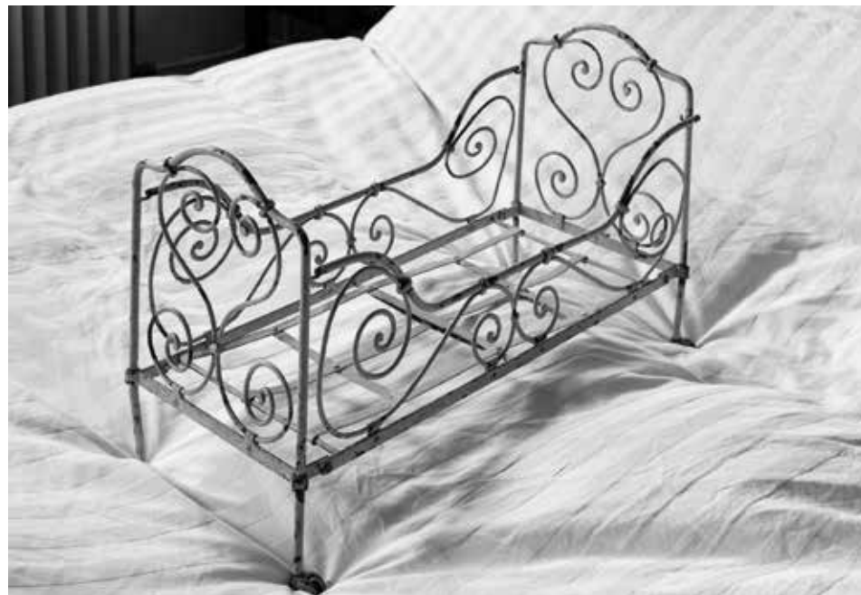
„Bett im Bett“, 2018 S/W-Fotografie, analog, Vergrößerung auf Barytpapier 30 x 40 cm, Edition 12

Geboren 1958 in Erlangen. Studium Klassische Philologie und Geschichte in München und Berlin bis 1983. 1984/85 an der Werkstatt für Photographie in Kreuzberg; Fotografie seit 1979. Erste Ausstellung 1986 in der Galerie im Körnerpark, Neukölln. Seither Ausstellungen und Veröffentlichungen in Büchern, Katalogen und Magazinen. Seit 2014 auch als Galerist im eigenen Atelier tätig.