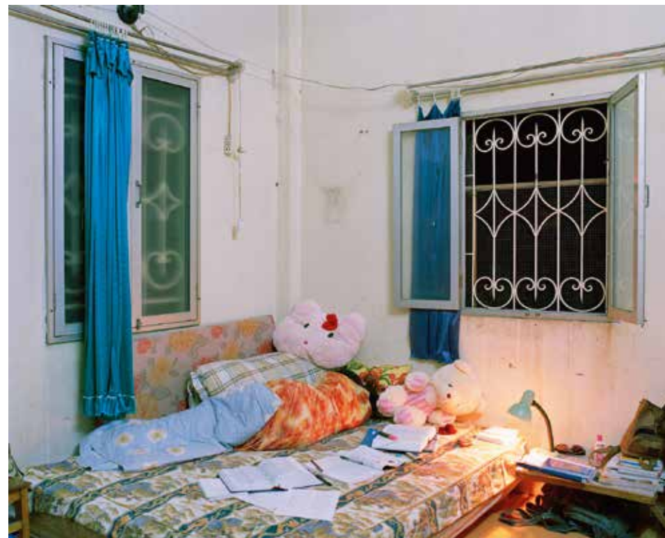
„Heimat – Que Huong“, 2010 C-Print, gerahmt, 52 x 60 cm, Edition 5 + 1 AP

1971 in München geboren, 1993-1999 Diplomstudium Fotografie und Medien an der Fachhochschule Bielefeld bei Jürgen Heinemann, seit 1999 freiberufliche Fotografin im Bereich Porträt, People, Reise und Dokumentation, weltweit seit 1999 Einzel- und Gruppenausstellungen, weltweit seit 2007 Lehrtätigkeit an der Designschule BEST Sabel, Berlin und Workshops weltweit, seit 2015 Professur für Fotografie an der Hochschule für Medien, Wirtschaft und Kommunikation Berlin.