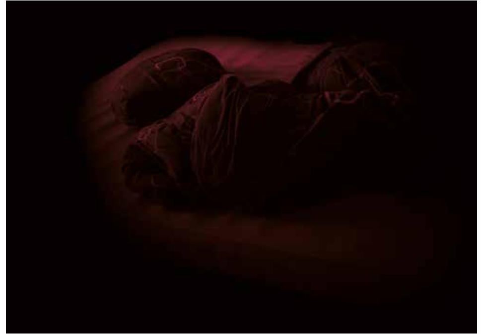
„Private_1008642“, 2017 C-Print auf Hahnemühle-Photrag, 42 x 59,4 cm, gerahmt, Edition 5 + 1 AP

* 1962 in Padua, Italien. Lebt und arbeitet seit 1985 in Berlin. Studium der Germanistik, Linguistik und Spanisch. Freie Fotografie seit 2003. 2007-2008 Seminar bei Jonas Maron an der Ostkreuzschule für Fotografie. 2005 Gründungsmitglied der Produzentengalerie „Galerie en passant“, heute ep.contemporary. 2009-2014 Jurymitglied Stiftung Kunstfonds, Bonn. Seit 2008 Initiatorin und Organisatorin des jährlich stattfindenden Kulturrundgangs Südwestpassage Kultour in Berlin Friedenau.