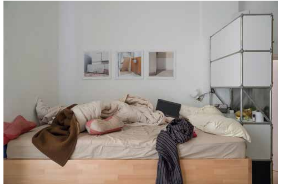
Ohne Titel, 2018 Fine-Art-Pigmentdruck, 30 x 20 cm, gerahmt 45 x 35 cm, Unikat