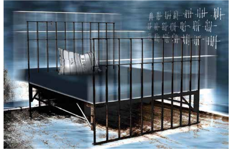
"BED/BAD MEMORIES", 2017 C-Print hinter ACRYL-Rahmenbox, 30 x 45 cm, Edition 10 + 1 AP

Geboren in Berlin. Wohne in Friedenau. Hier künstlerisch aktiv in der Fotografie, Malerei und Grafik. Meine Wege: Studium als Gebrauchsgrafikerin / Grafikdesign in Werbeabteilungen / Reprotechnik im Fotolabor und Grafik, analog und digital zur Darstellung geologischer Sachverhalte, Bereich Fernerkundung FU Berlin / Weiterbildung FH für Foto-Optik Berlin / Workshops Akademie für Malerei / Digitalgenerierte Malerei / Experimentelle Fotografie, zuletzt Schwerpunkt Schwarz-Weiss / Öffentliche Präsentationen, Einzel- und Gruppenausstellungen in verschiedenen Kunstforen / Seit 2011 Teilnahme an der "Südwestpassage Kultour" / in diesem Jahr wieder Artist bei SHOW YOUR DARLING.