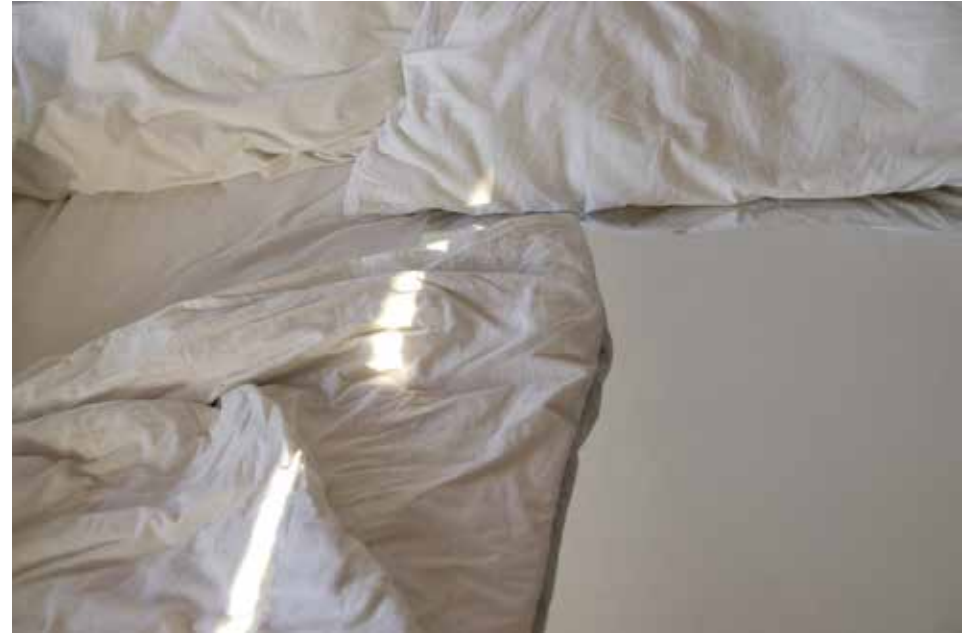
„Bett-Spiegel“, 2018 C-Print auf Hahnemühle FineArt, gerahmt 30 x 40 cm, Edition 5 + 1 AP

Geboren 1967 in Stuttgart, lebt und arbeitet in Berlin; 1993 Stipendium am Royal College of Arts, London; 1995 Meisterschülerin an der Universität der Künste Berlin bei Prof. Schoenholtz; 1997 1. Staatsexamen Bildende Kunst, UdK Berlin; 1999 2. Staatsexamen Bildende Kunst, Berlin; 2006-2013 Mitglied der Produzentengalerie "en passant", Berlin.