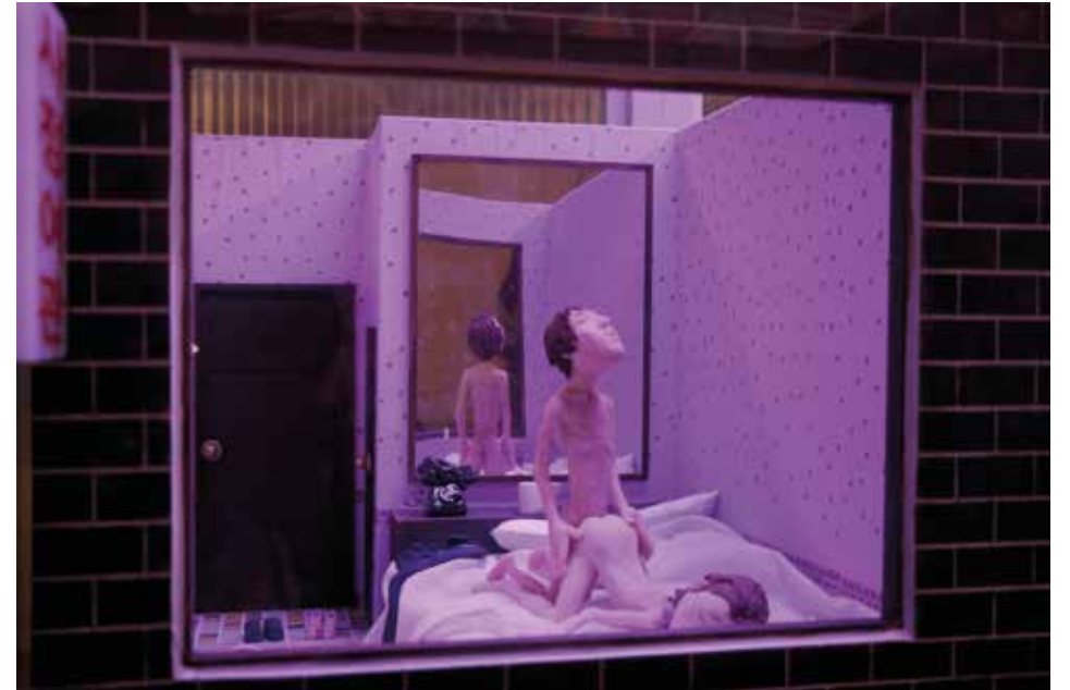
„Ejaculation Motel“, 2011 PigmentPrint, 42 x 59,4 cm gerahmt, Edition 5 + 1 AP

Based in Seoul, South Korea, Nils has shot, directed and edited a number of award-winning music videos, short, feature and documentary films, which have been screened at various international festivals or went viral online. Initially Nils found his way into filmmaking through photography. After studying in Germany, Australia and Hong Kong, Nils completed his MFA in Cinematography at the Graduate School of Advanced Imaging Science, Multimedia and Film at Chungang University in Seoul. Born and raised in Germany, Nils has been living in South Korea since the end of 2005.